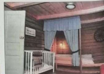
Kartanon alkuperäisrakennuksiin lukeutuvaa aittaavaa mahtuu kahdeksasta kymmeneen majoittajaa.