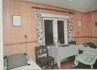
Kahden hengen huone on sisustettu perinteitä kunnioittaen.

Viime kesänä Ruutin kartanolla aloitettiin Airbnb-majoituskokeilu. Airbnb on tällä hetkellä erittäin suosittu trendi majoitusalalla. Airbnb-majoituksessa omistaja vuokraa huoneistoaan nettisivuilla yksityishenkilöille. Kokeilu ylitti kaikki odotukset: majoitustilat oli varattu täyteen koko kesäksi. Majoit-