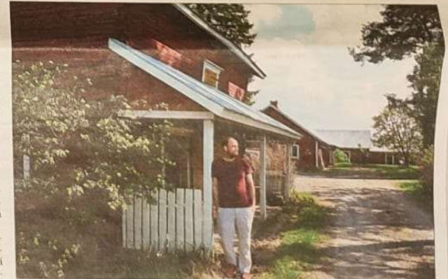
Ruutin kartanon aitta on yksi Airbnb-kohteista Laihialla. Pihapiiri huokuu maaseudun rauhaa.

Peltojen ympäröimä pihapiiri tuo rauhaan tuheen majoittujille, ja siellä voi istia raikasta maaseudun tunnelmaa.