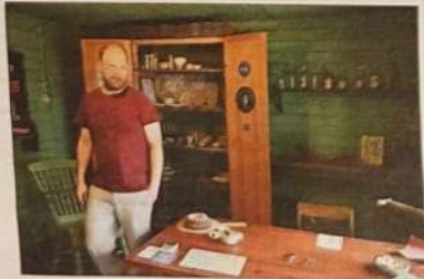
Majoituksen vastaanotto on sisustettu vanhaan tyyliin. Sisustusta on vaalittu vanhaa kunnioittaen.