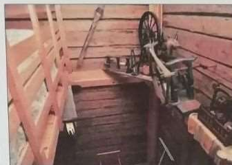
Aitassa on esillä myös vanhaa esineistöä.